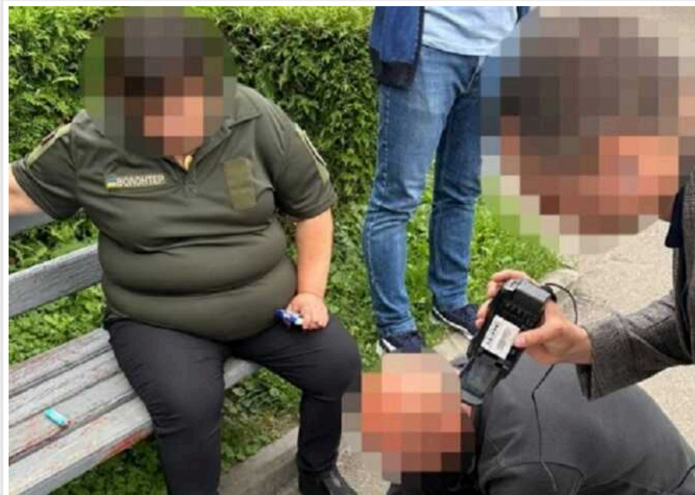
У Рівному затримали жінку за підозрою в спробі підкупити слідчого ДБР

У Рівному правоохоронці затримали жінку, яку підозрюють у спробі дати хабар слідчому Державного бюро розслідувань. За даними слідства, вона намагалася домовитися з ним про закриття чотирьох кримінальних проваджень щодо дезертирства. За це пропонувала 12 тисяч доларів.