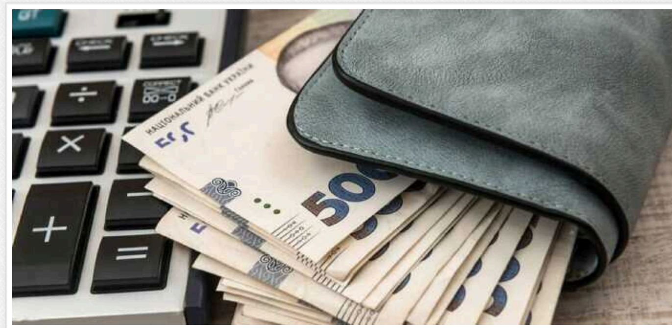
У Мінекономіки розповіли про зростання зарплат в Україні

Українські підприємства підвищують рівень оплати праці з метою утримання та залучення нового висококваліфікованого персоналу в умовах нестачі трудових ресурсів у країні.