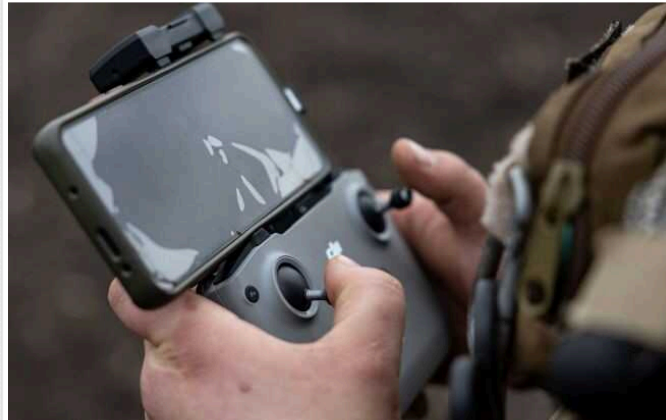
ЗСУ вперше вдалося збити російський гелікоптер у повітрі за допомогою FPV-дрону, – Forbes

Forbes пише, що, ймовірно, ЗСУ вчора вперше вдалося збити російський гелікоптер у повітрі за допомогою дрона.