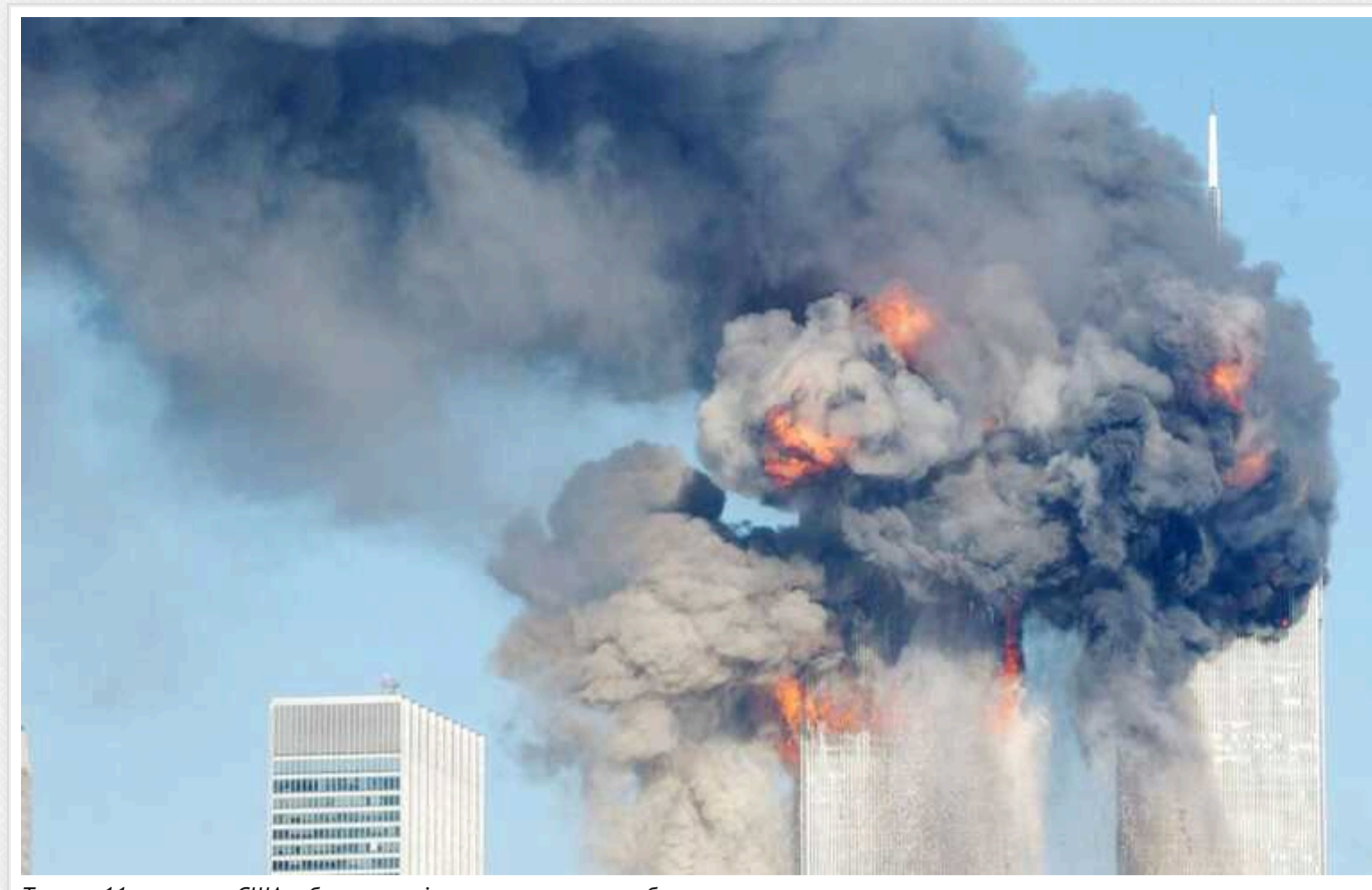
Теракт 11 вересня у США: обвинувачені визнали провину, щоб уникнути страти

Троє чоловіків, звинувачених у підготовці терактів 11 вересня 2001 року в США, погодилися визнати свою провину в обмін на довічне ув'язнення замість страти.