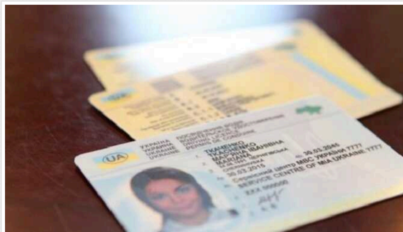
В Україні почали видавати водійські посвідчення нового зразка

Водночас старі водійські посвідчення та свідоцтва про реєстрацію залишаються чинними до кінця терміну їхньої дії.