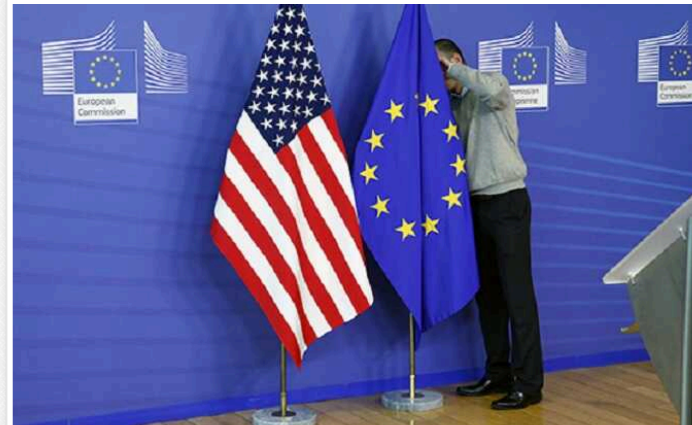
ЄС і США намагаються зупинити ймовірну війну на Близькому Сході

Дипломати намагаються умовити Іран або не відповідати на атаку Ізраїля, або обмежитися символічними діями.