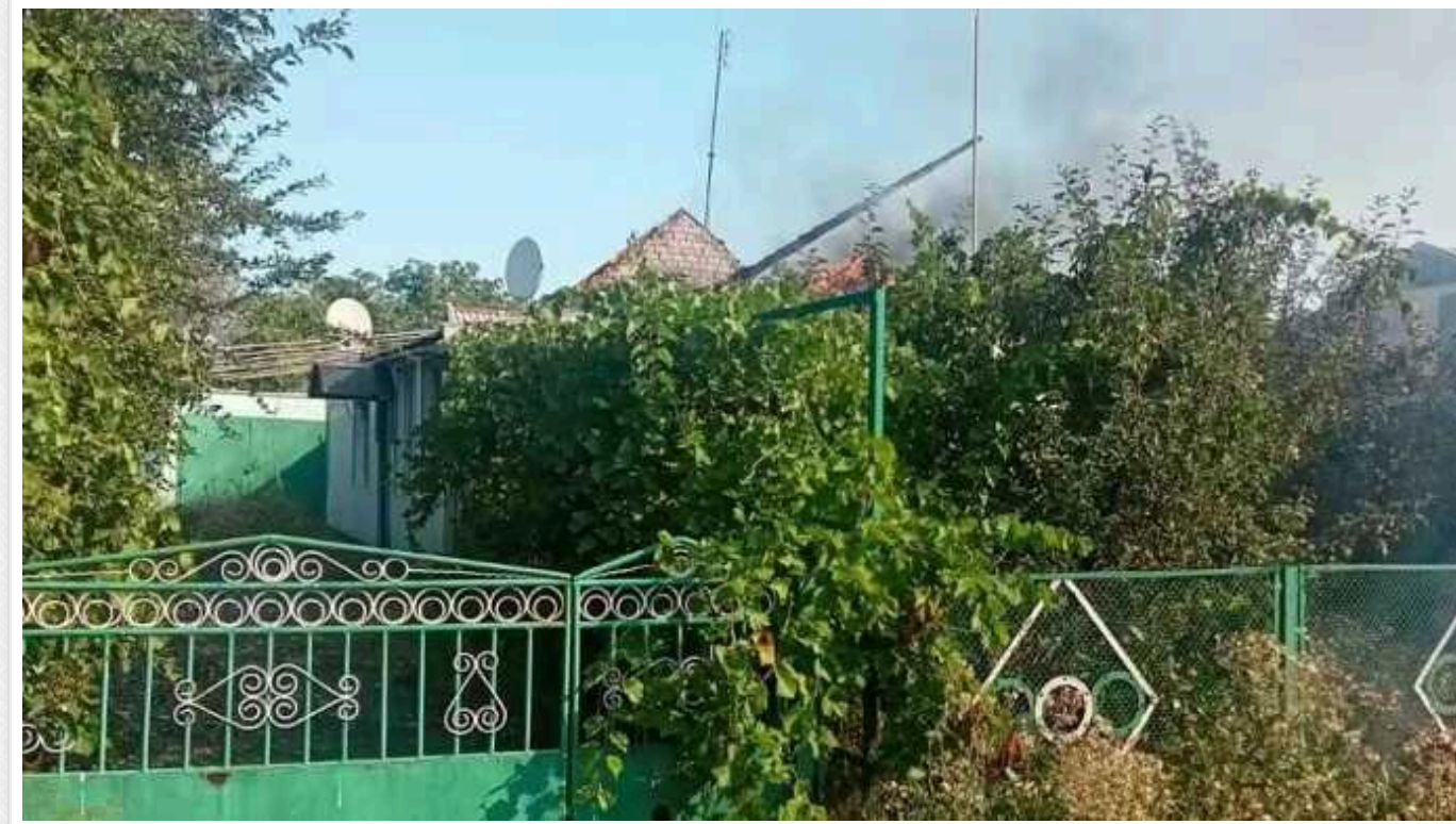
Окупанти понад 400 разів били по Запорізькій області: поранили людину, пошкодили інфраструктуру

Упродовж минулої доби російські окупанти завдали 408 ударів по 10 населених пунктах Запорізької області, у результаті чого одна людина дістала поранення, пошкоджені житлові будинки та об'єкти інфраструктури.