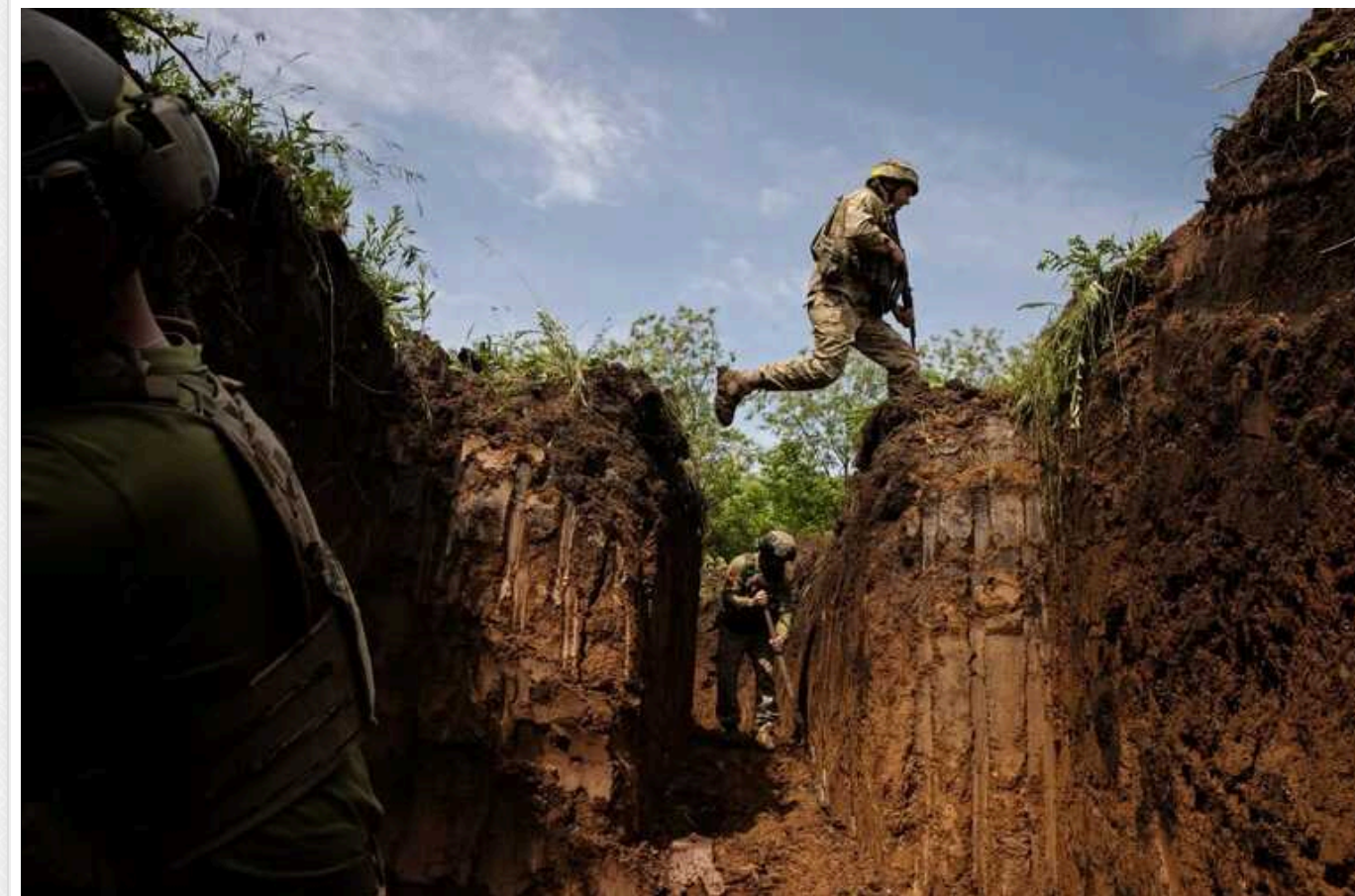
DeepState: ЗС РФ окупували Тимофіївку, просунулися біля 6 населених пунктів

Російська окупаційна армія захопила селище Тимофіївка Донецької області, а також просунулася біля 6 населених пунктів.