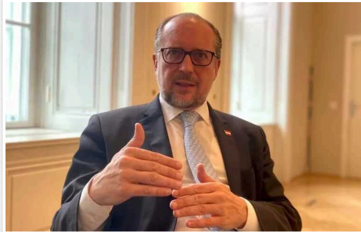
МЗС Австрії закликав не схиляти Україну до поступок територією

Заклики до України ззовні, щоб вона поступилася державі-агресорці Росії територіями в обмін на мир, є неприпустимими. Лише український народ має право вирішувати, коли йти на переговори з тим, хто розв'язав війну проти його держави.