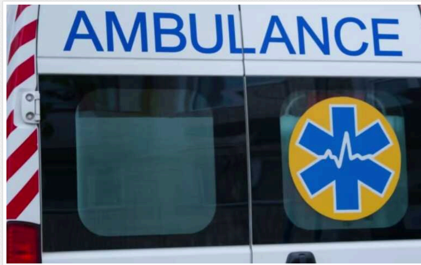
На Сумщині через ворожий обстріл постраждав чоловік

Російська армія 31 липня 28 разів обстріляла прикордонні території та населені пункти Сумщини, відомо про пораненого місцевого.