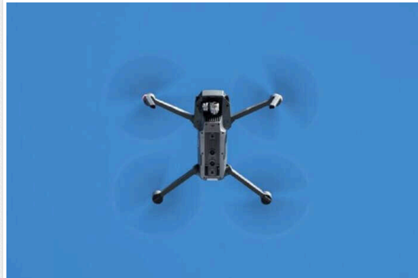
КНР заборонить експорт дронів, які можуть використовуватись у війнах

Китай заявив, що заборонить експорт усіх цивільних безпілотників, які можуть використовуватися у військових цілях або в терористичній діяльності. Також будуть обмежені деякі функції дронів через критику з боку США та їхніх союзників за позицію Китаю щодо повномасштабного вторгнення Росії в Україну.