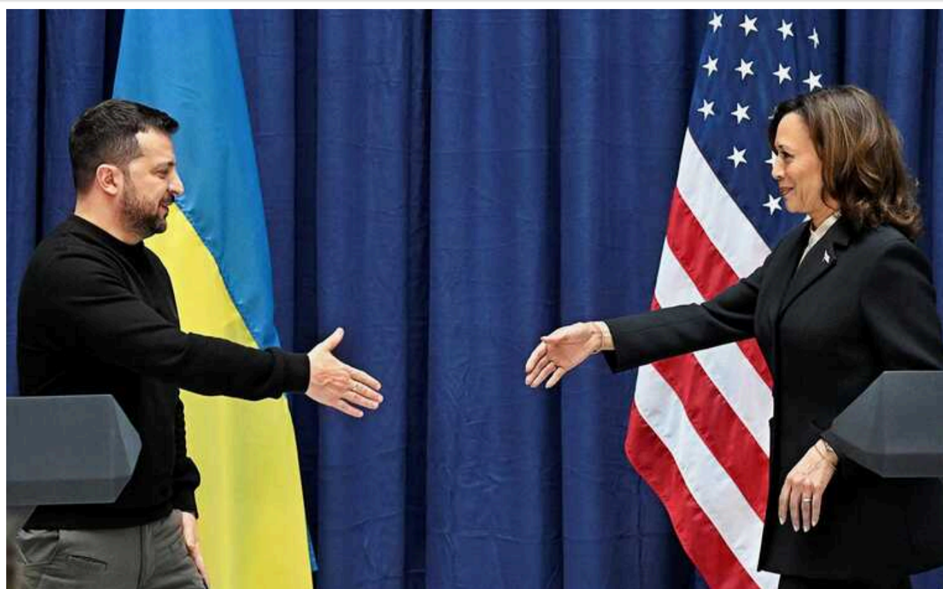
Time: Взаємини між Камалою Гарріс і Володимиром Зеленським - "непрості"

Видання нагадує, що в середині лютого 2022 року віцепрезидентка США вирушила до Європи з місією інформування про можливу війну. Одним із її завдань була зустріч із Зеленським і донесення до нього, як США мають намір реагувати на початок військових дій.