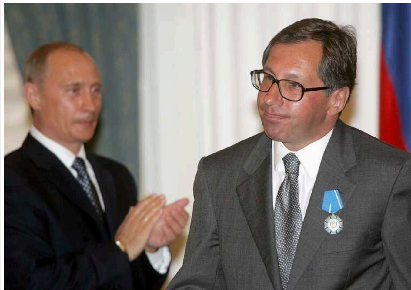
Путінський олігарх із «Альфа-груп» Петро Авен виводить активи з-під санкцій у Латвії. Що з його активами в Україні?

Журналісти виявили чергову частину мережі путінських олігархів, за посередництва якої через Латвію виводяться капітали з Росії до Європи та в офшори. До неї причетний Петро Авен, голова Наглядової ради «Альфа-банку», який торік був націоналізований урядом України.