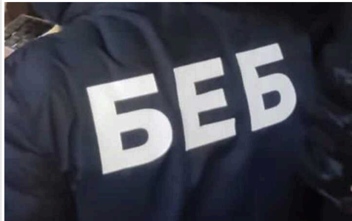
БЕБ викрило злочинну групу, яка незаконно заробила на дровах для потреб ЗСУ