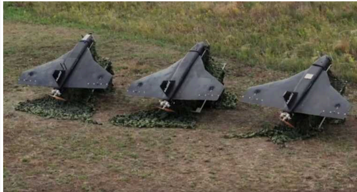
Сьогодні вночі та вранці Україну могли атакувати не "Шахеда", а легші російські дрони "Гербера"