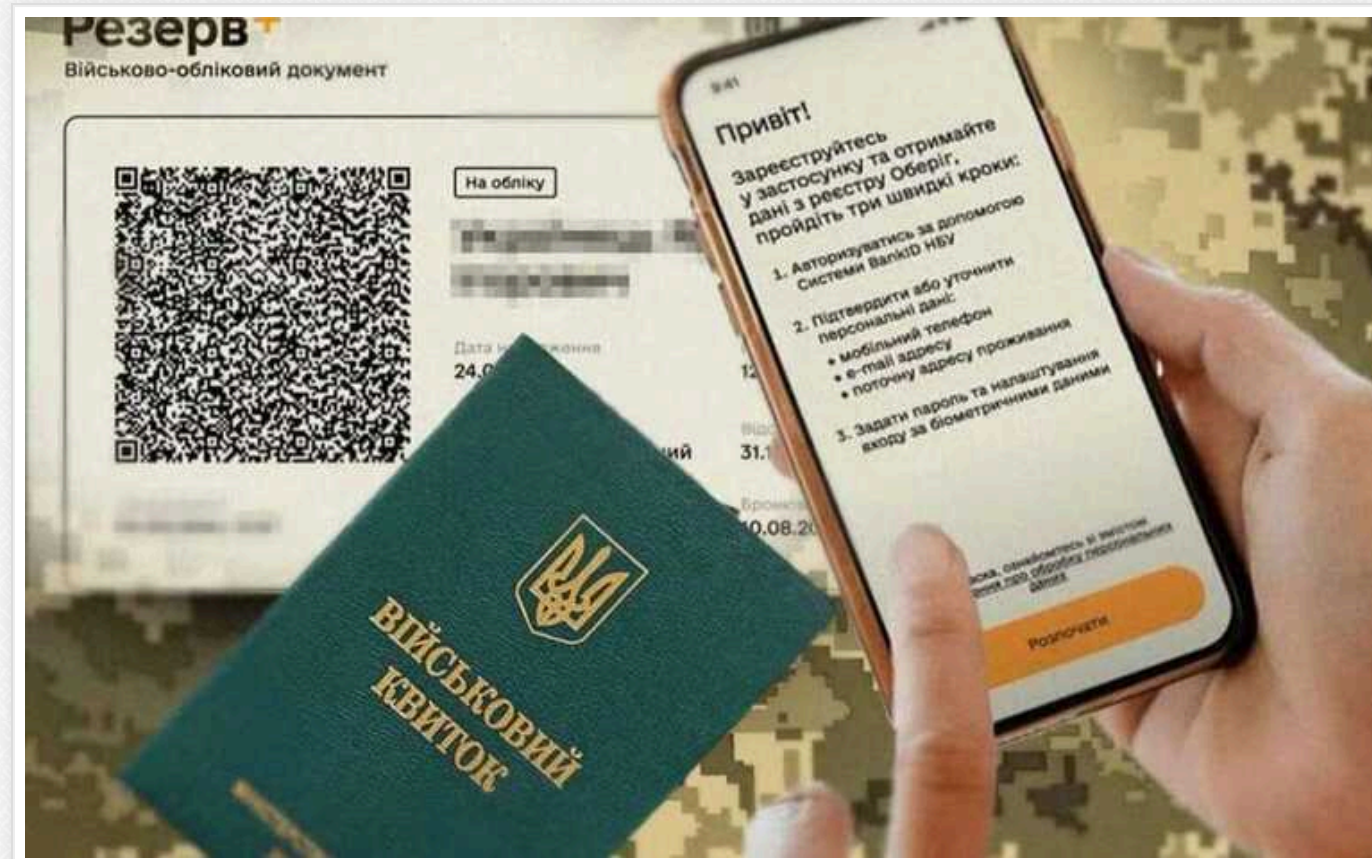
Електронний військово-обліковий документ має таку ж юридичну силу, як і паперовий, – Міноборони

Електронний військово-обліковий документ має таку ж юридичну силу, як і паперовий.