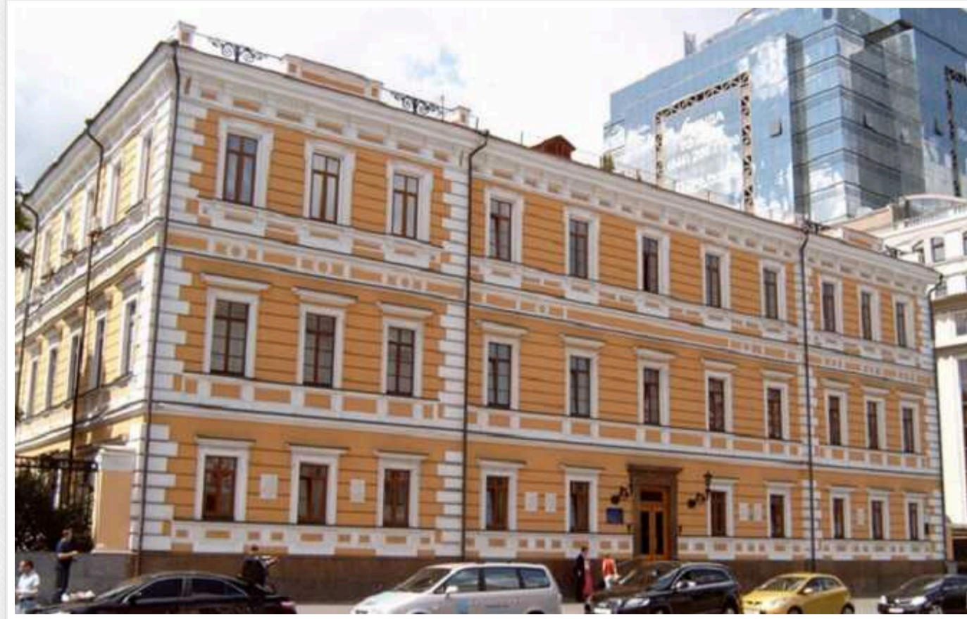
В НАНУ замовили кабелі та проводи за 1 мільйон: ціни на третину вищі за ринкові

ДУ «Науковий центр гірничої геології, геоекології та розвитку інфраструктури НАН України» 12 червня за результатами тендеру замовила ТОВ «Компанія «Вестдевелопмент» кабелів і проводів на 936 тис грн.