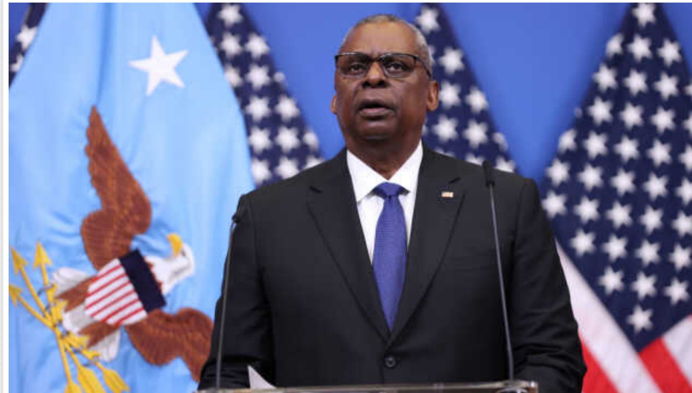
Повномасштабна війна на Близькому Сході не є неминучою, - міністр оборони США

Міністр оборони США Ллойд Остін не вважає широкомасштабну війну на Близькому Сході неминучою, однак запевнив, що США допоможуть Ізраїлю захищатися в разі нападу.