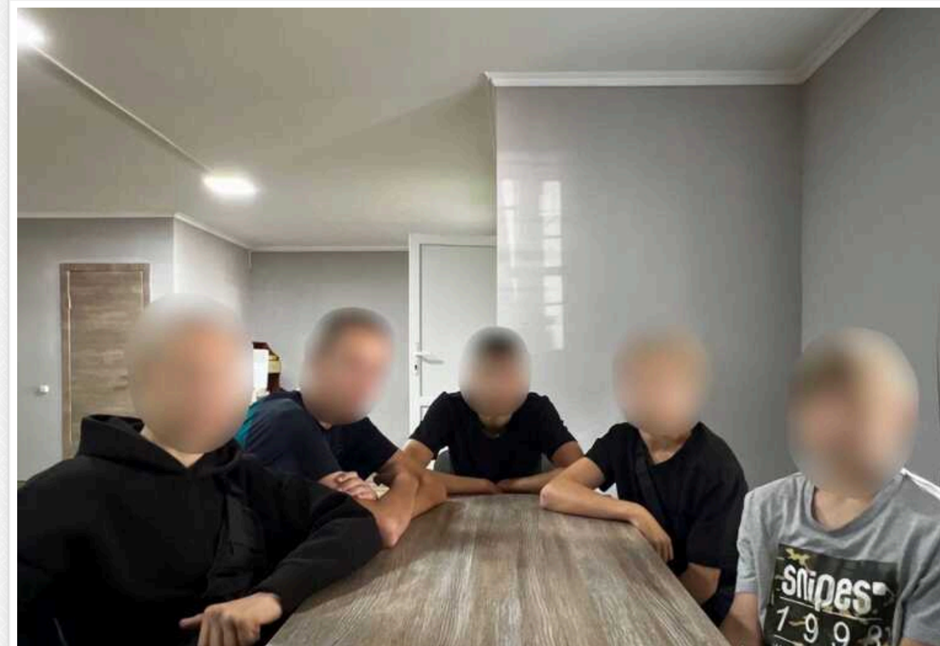
На Київщині поліцейські встановили особи підлітків-зачеперів, які катались на дахах електропотягів

Правоохоронці Київської області встановили групу неповнолітніх зачеперів. Підлітки впродовж двох літніх місяців катались на дахах електропотягів території Бучанського району.