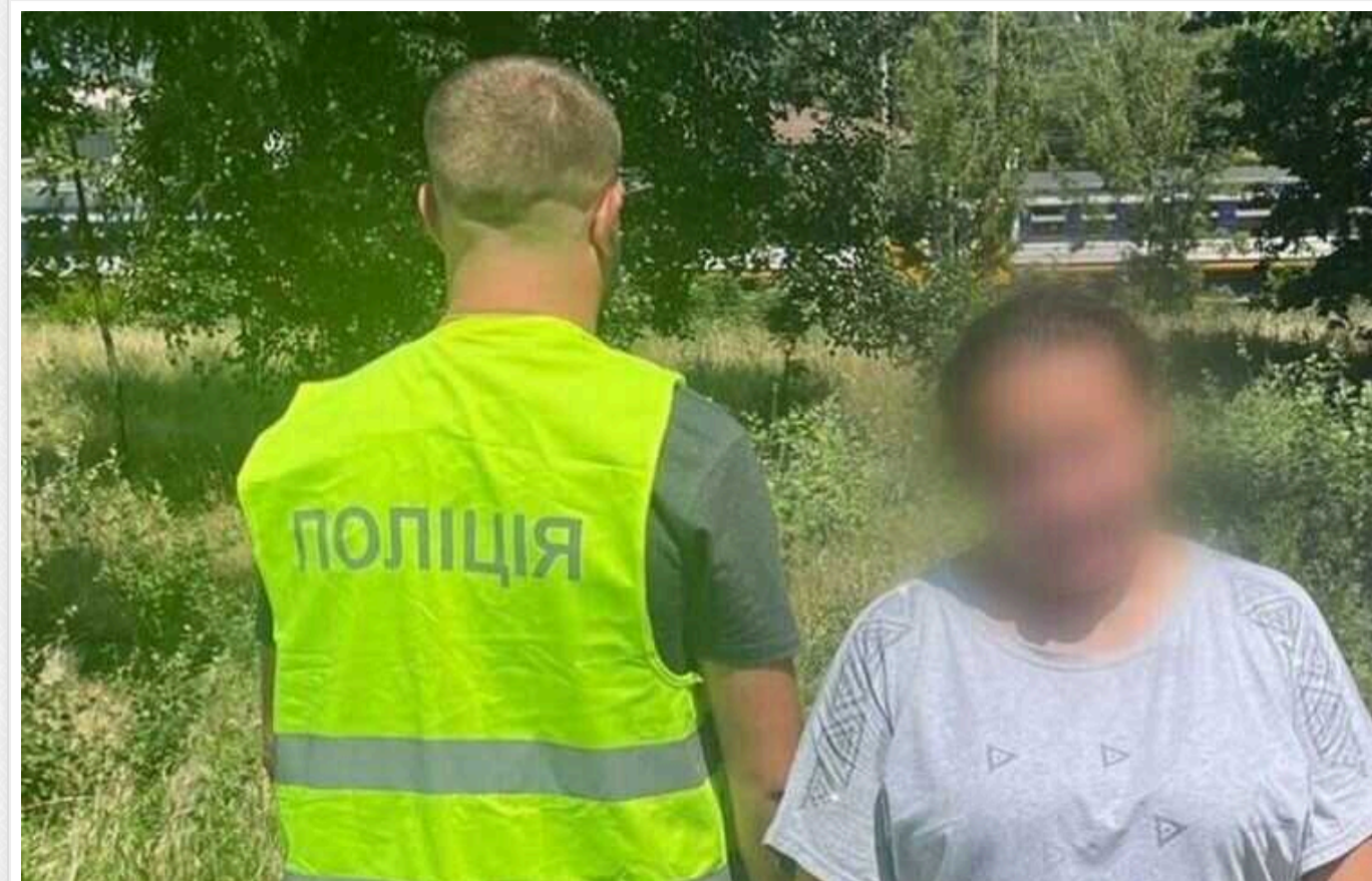
Поліцейські Києва викрили "волонтерку": "збирала" гроші на генератори та автівки для ЗСУ

Правоохоронці Києва викрили жінку, яка, за інформацією слідства, причетна до шахрайства. "Волонтерка" ошукала громадян під приводом збору коштів на генератори та автівки для українських військових.