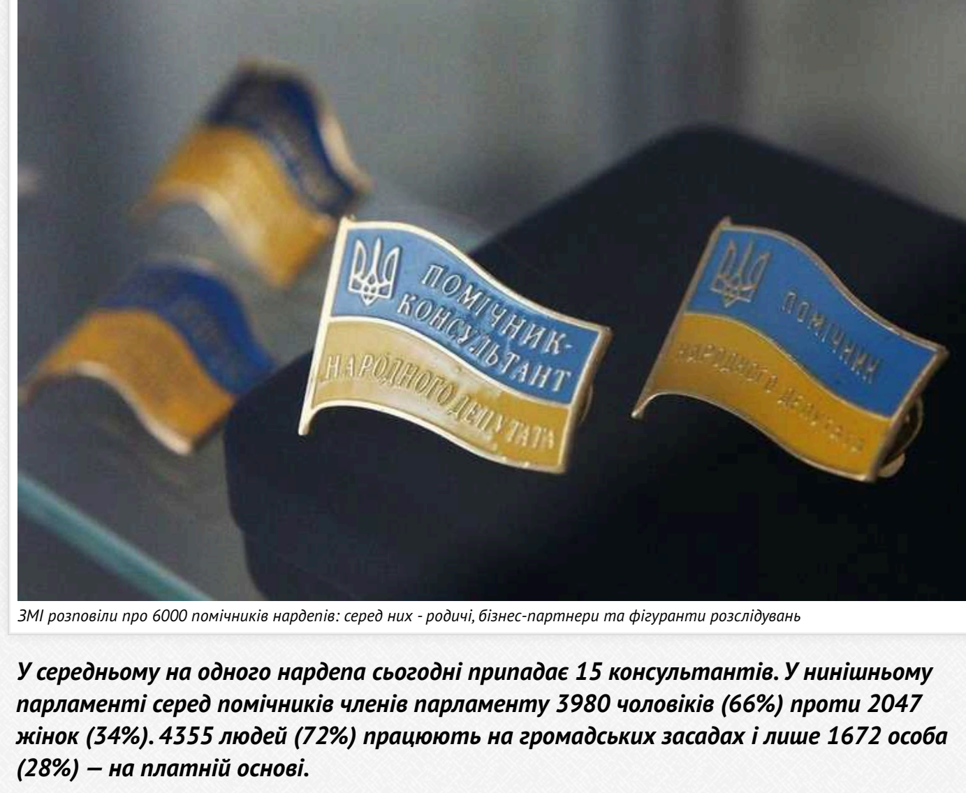
ЗМІ розвиває про 6000 помічників нардепів: серед них - родичі, бізнес-партнери та фігуранти розслідувань

У сервированні на одного нардепа сьогодні припадає 15 консультантів. У мініньшому парламенті серед помічників членів парламенту 3980 чоловіків (66%) проти 2047 жінок (34%), 4355 людей (72%) працюють на громадських засадах і лише 1672 особа (28%) – на платній основі.