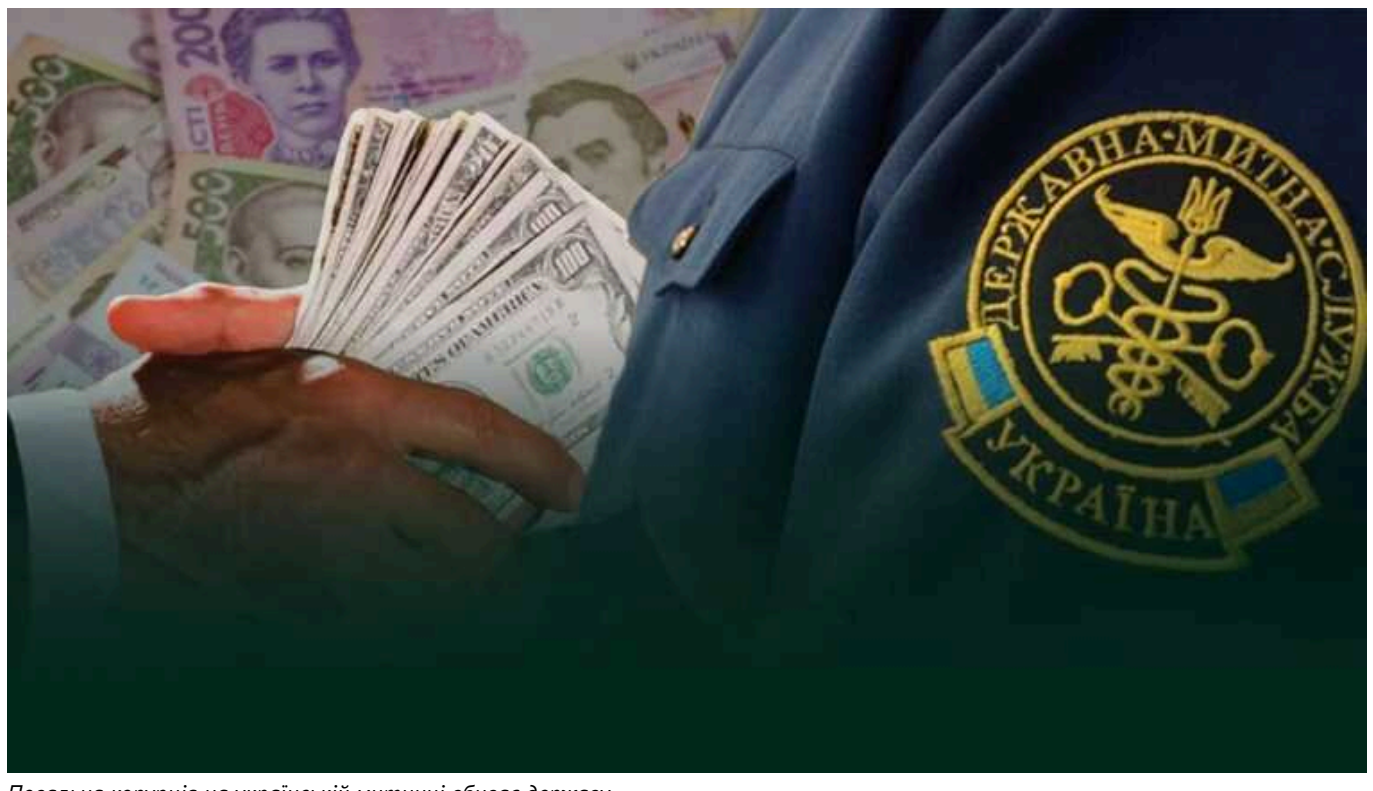
Повальна корупція на українській митниці вбиває державу

Слова "корупція" вже давно стало повноцінним евфемізмом для словосполучення "українська митниця".