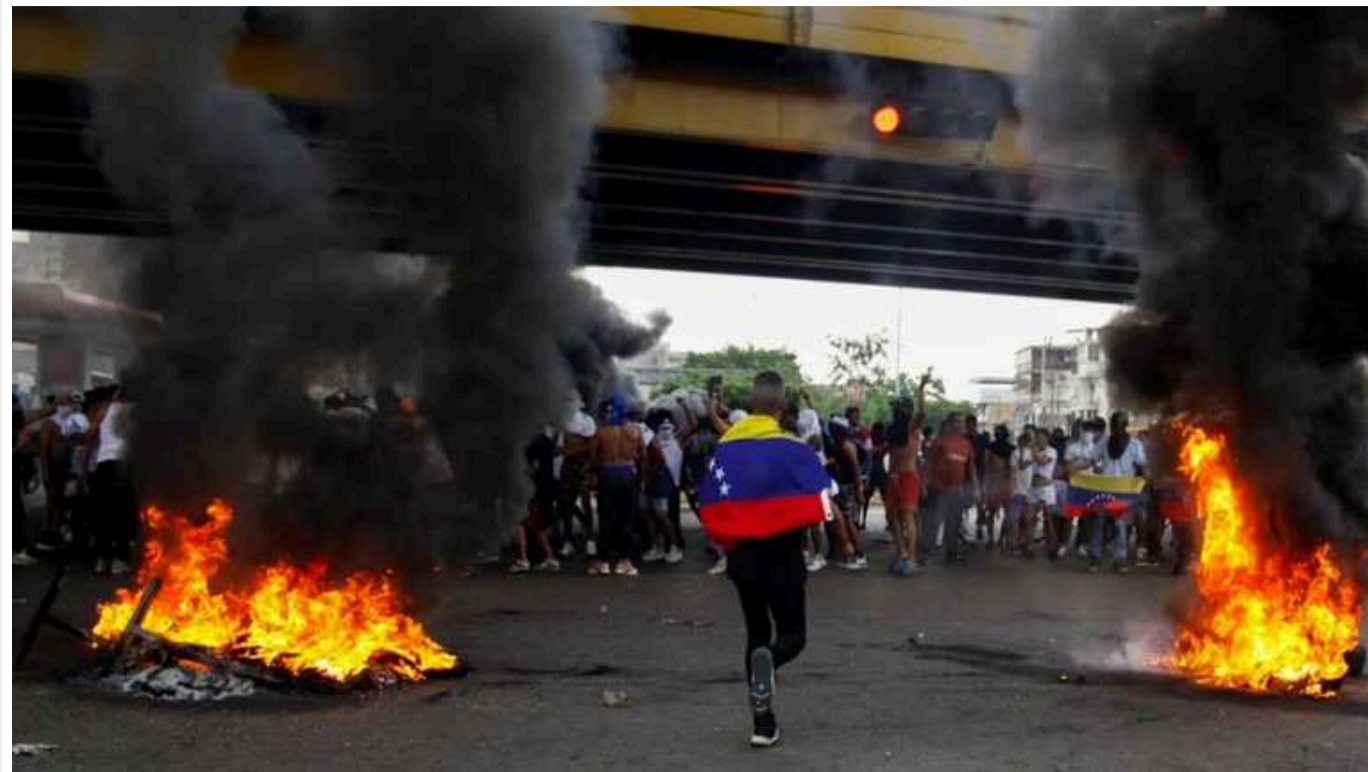
МЗС Венесуели заявило про розрив дипвідносин із Перу

Венесуела розірвала дипломатичні відносини з Перу у відповідь на «нерозважливі заяви» Ліми щодо результатів президентських виборів.