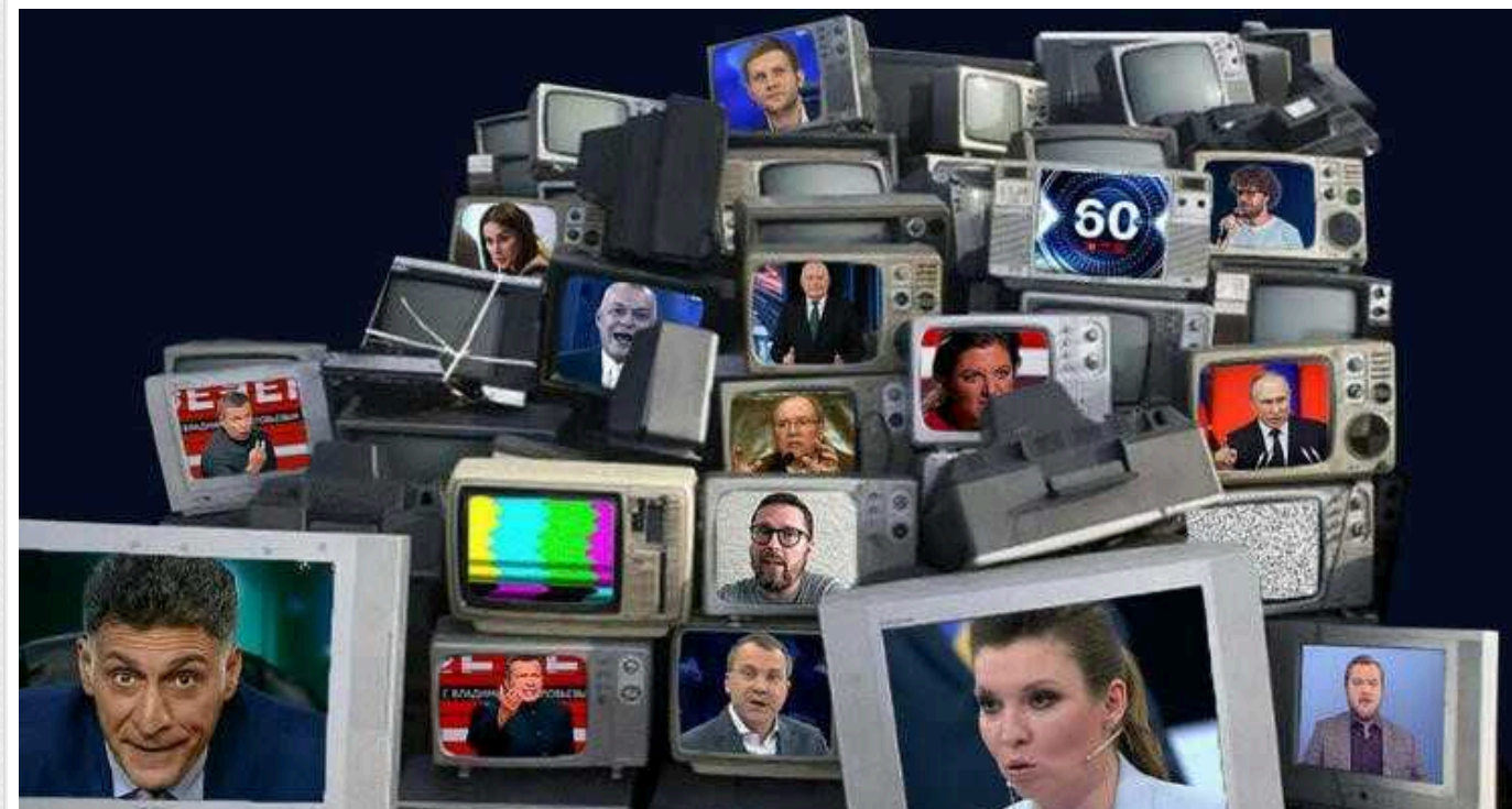
Роспропагандист похвалився "високоточним" ударом по Україні, хоча всі цілі були збиті українським силами ППО

У Росії похвалилися серією ударів по Україні, заявивши про нібито ураження військових об'єктів Збройних сил України. Уражені цілі привиділися росіянам у різних областях України, попри те, що всі дрони та ракети, які запустив ворог цієї ночі, були знищені нашою ППО.