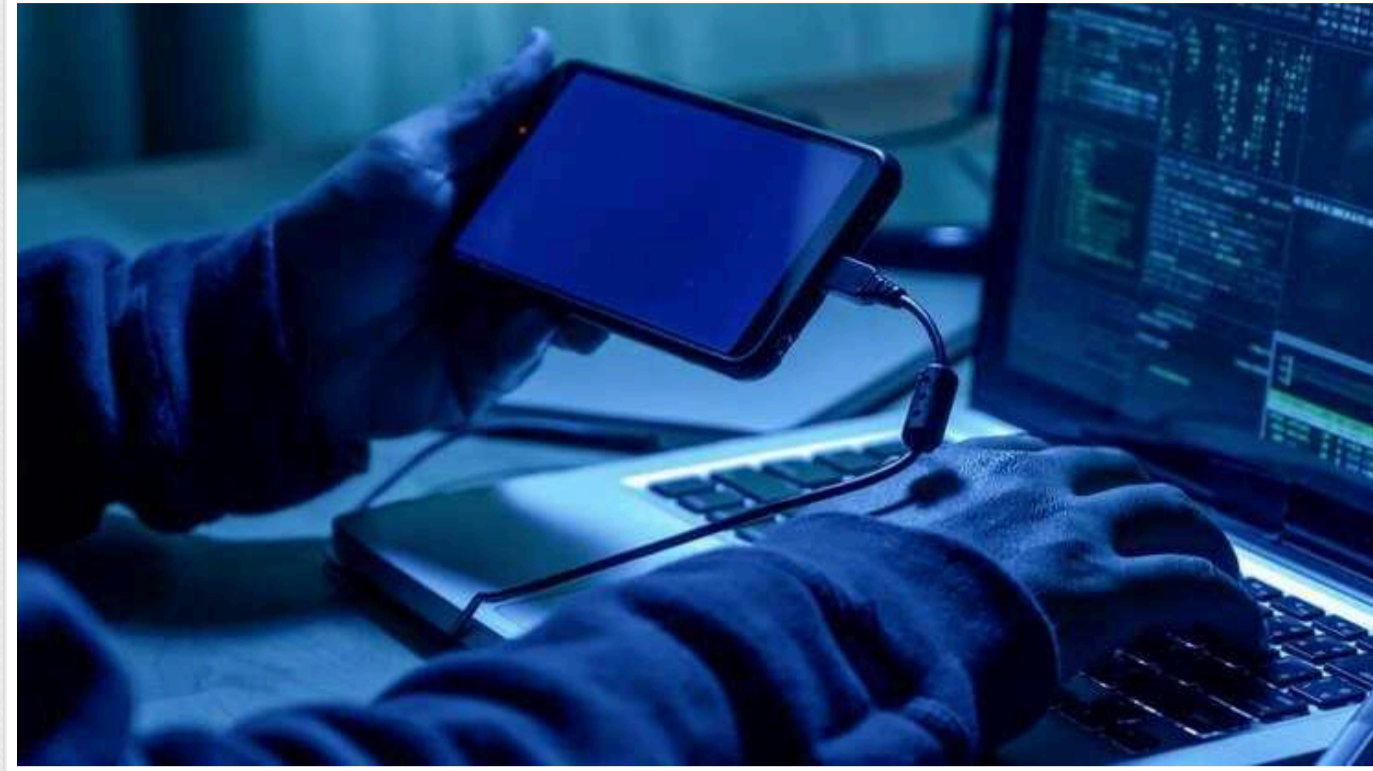
З'явилися нові дані про масштабну кібератаку ГУР на фінсектор і урядові ресурси Росії

Головне управління розвідки Міністерства оборони України завершило масштабну кібератаку на фінансовий сектор та урядові ресурси країни-агресора РФ. У результаті було уражено критично важливі ресурси та отримано доступ до великого масиву конфіденційних даних.