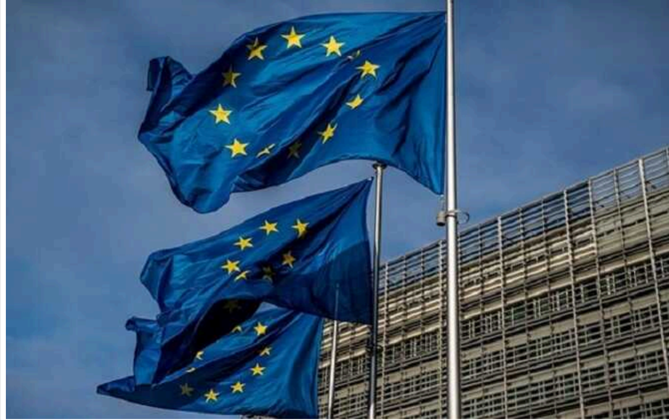
У ЄС не змогли погодити заяву з критикою виборів у Венесуелі, – Politico

Країни Європейського Союзу не змогли погодити спільну заяву з критикою виборів у Венесуелі після того, як Угорщина наклала чергове вето.