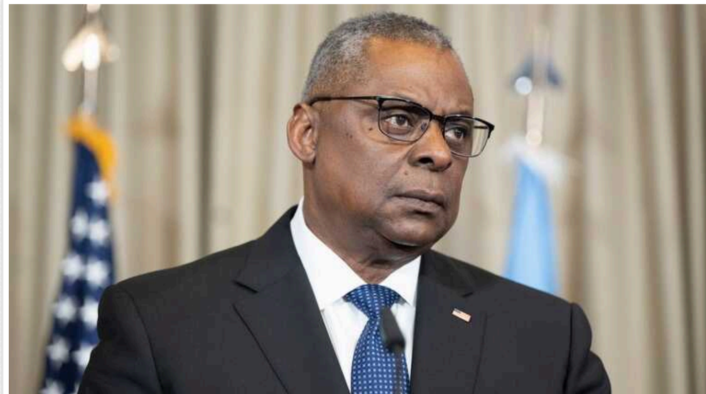
Ллойд Остін пообіцяв захистити Ізраїль у разі нападу з боку Ірану

Вашингтон допоможе захистити Ізраїль, якщо він зазнає нападу. При цьому він працює над зниженням напруженості у регіоні після ліквідації лідера ХАМАСу Ісмаїла Хані в Ірані.