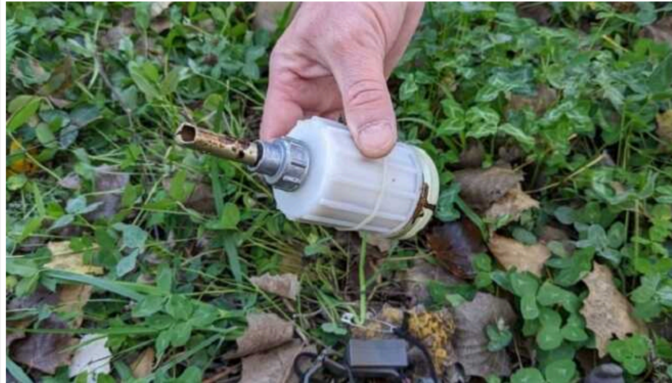
Окупанти використовують заборонену зброю, яку застосовували ще у Донецькому аеропорту

У районі Глибокого росіяни почали застосовувати мисливську зброю, якою вони намагаються збивати українські FPV-дрони.