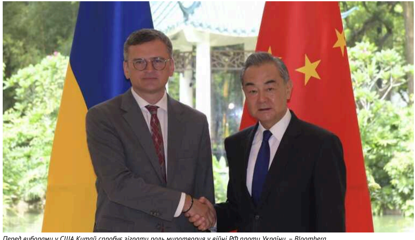
Перед виборами у США Китай спробує зіграти роль миротворця у війні РФ проти України, – Bloomberg

«Шквал активності» Китаю у дипломатичних ініціативах підкреслює прагнення лідера країни Сі Цзіньпіна посилити свою роль перед можливою різкою зміною курсу, яка може відбутися після виборів у США, ідеться у матеріалі Bloomberg .