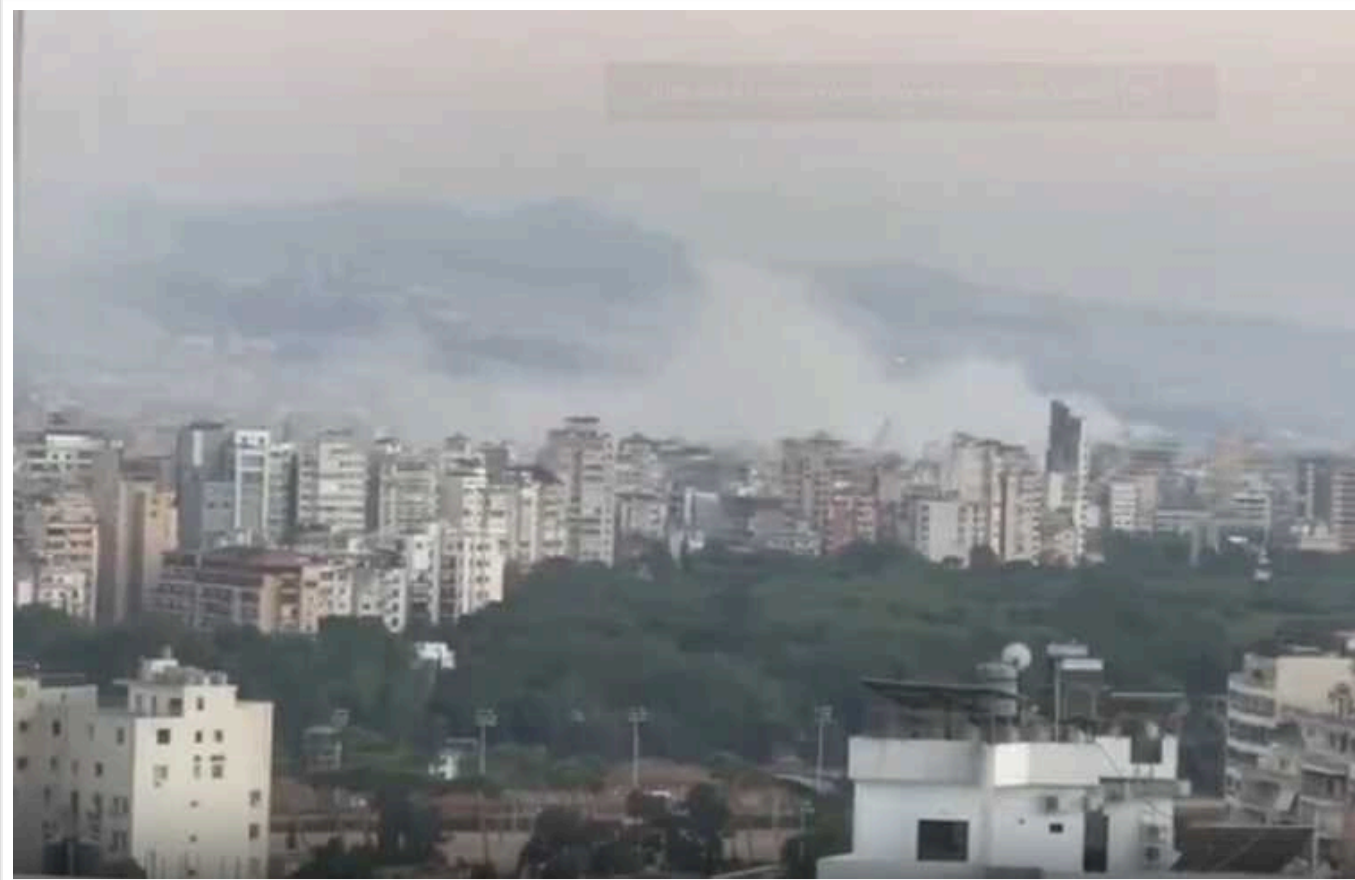
Ізраїль завдав удару помсти по Лівану: повідомляють про ліквідацію одного з лідерів "Хезболли"

Увечері вівторка, 30 липня, ЦАХАЛ завдала точкового удару по Бейруту. Унаслідок цього було ліквідовано одного з лідерів "Хезболли", відповідального за вбивство дітей у Маджаль-Шамсі та смерть багатьох ізраїльських громадян.