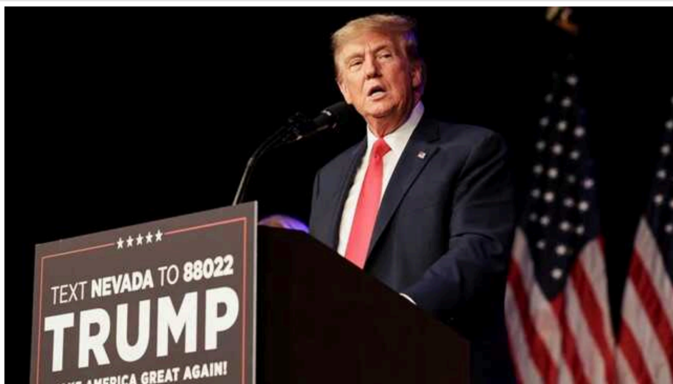
На передвиборних заходах ім'я Трампа згадується в молитвах частіше, ніж Ісуса Христа

Журнал The Atlantic підрахував, що в молитвах на передвиборних заходах Трампа його ім'я згадується частіше (87 разів), ніж Ісуса Христа (61).