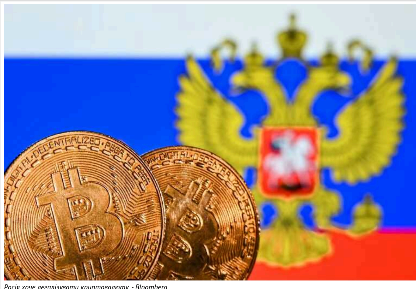
Росія хоче легалізувати криптовалюту, - Bloomberg

Росія прагне легалізувати криптовалюту, оскільки компанії зазнають дедалі більших труднощів при здійсненні міжнародних платежів через загрозу вторинних санкцій.