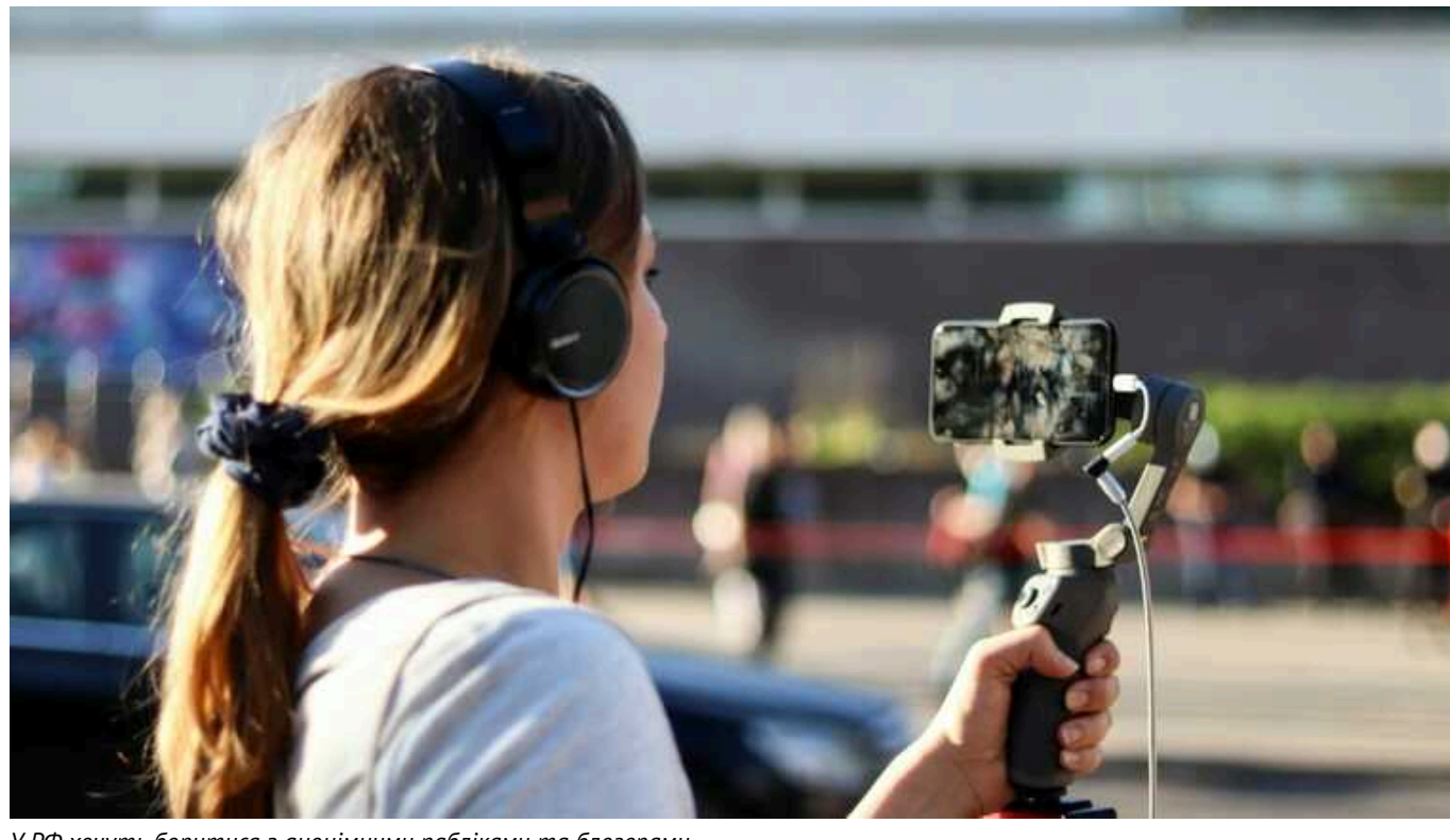
У РФ хочуть боритися з анонімними пабліками та блогерами

“Бі-бі-сі” пише, що в Росії боротимуться з анонімними пабліками та блогерами.