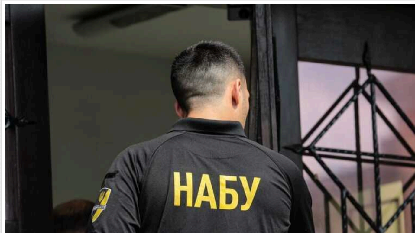
НАБУ і САП скерували до суду справу про одержання 176 тисяч євро та Mercedes-Benz Vbrabus експловою Полтавської ОДА

НАБУ і САП скерували до суду справу за обвинуваченням колишнього голови Полтавської ОДА та його радника в отриманні неправомірної вигоди в особливо великому розмірі.