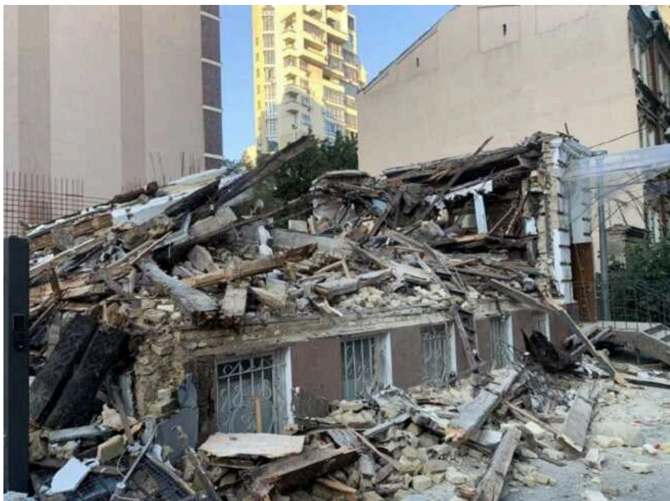
Забудовники діють проти історичного Києва: диверсія зі садибою Зеленських була показовою

"Мабуть, із кимось це було узгоджено, мабуть, ці люди на щось розраховували, раз вони посеред білого дня приїхали валити садибу". Якщо у тебе є ерші та вихід на кого треба у владі столиці, ти можеш будувати що завгодно і де завгодно.