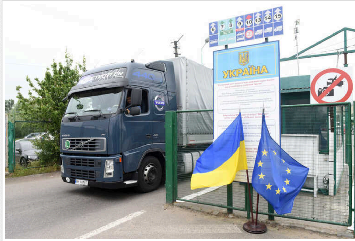
Для перевізників спрощують оформлення бронювання працівників від мобілізації, - Мінінфраструктури

Тепер, щоб набути статусу критично важливого, підприємству слід відповідати двом критеріям із семи, а не трьом, як раніше.