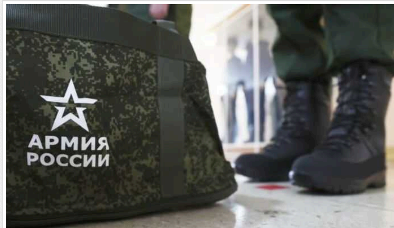
У мережі публікують файл, як виглядають виплати за укладення контракту з ЗС РФ

Найбільші виплати в Москві – $39 тисяч. Найменша – $11 тисяч, в маленькому місті.