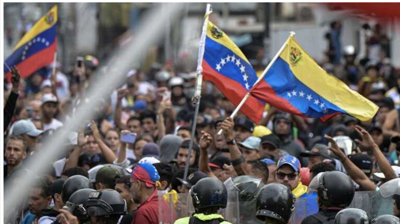
У Венесуелі на тлі протестів почали блокувати доступ до «Вікіпедії», – NetBlocks

Майже в усіх венесуельських провайдерів сайт не відкривається.