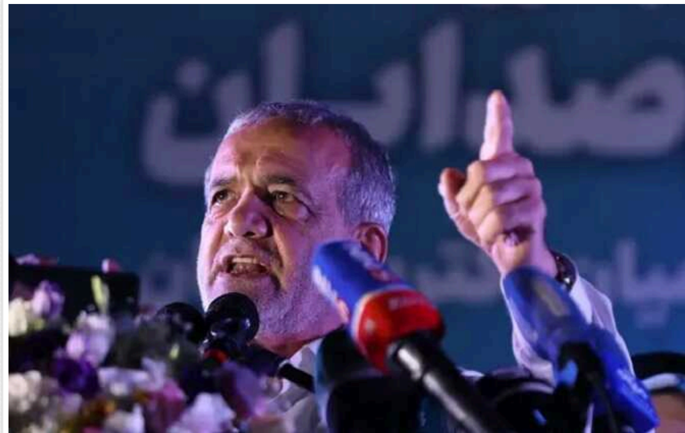
Президент Ірану пригрозив Ізраїлю "серйозними наслідками" в разі удару по Лівану

Новообраний президент Ірану Масуд Пезешкіан пригрозив Ізраїлю відповіддю в разі удару по Лівану. За його словами, будь-який можливий ізраїльський напад на Ліван матиме "серйозні наслідки" для Єрусалиму.