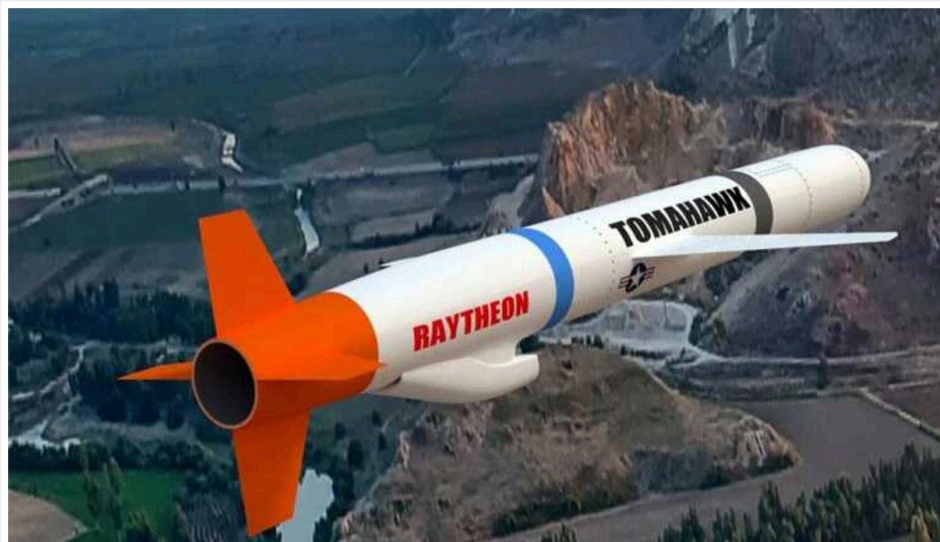
У Німеччині відповіли на погрози Путіна стратегічними ракетами

Росія змінила стратегічний баланс у Європі. Тому розміщення у Німеччині американських ракет буде фактором стримування. А погрози Путіна вжити "контрзаходів" нікого не лякають.