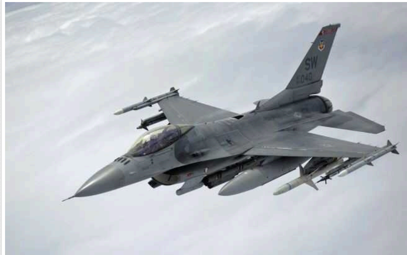
Через брак пілотів Україна зможе використати цього року не більше десяти F-16, - NYT

The New York Times пише, що Україна зможе використати цього року не більше десяти F-16 через брак пілотів.