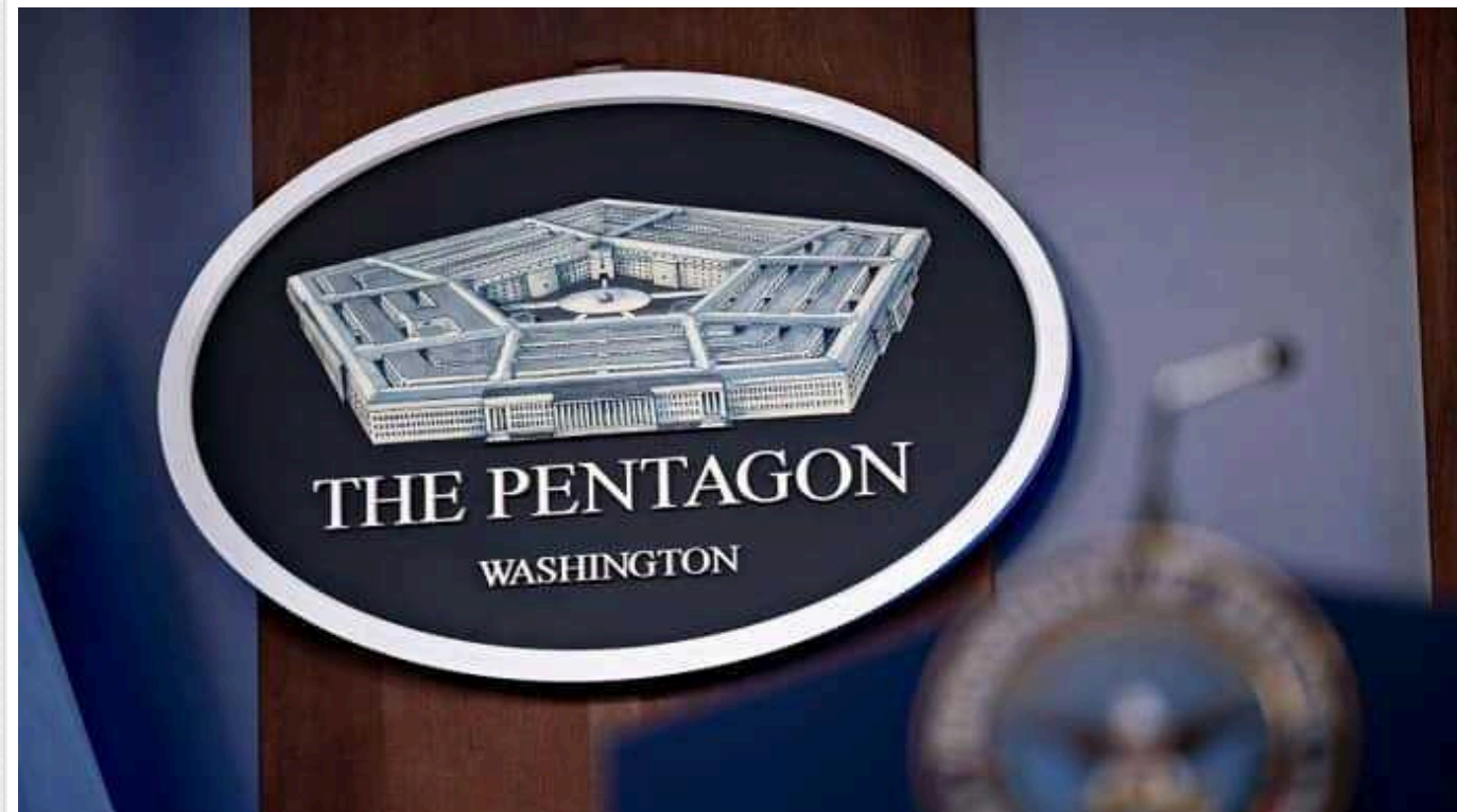
Пентагон опублікував повний список того, що ввійшло до нового пакету військової допомоги Україні від США

У Пентагоні уточнили, що для України анонсували два пакети військової допомоги. Один із них - вартістю 200 млн доларів, а інший - 1,5 млрд доларів.