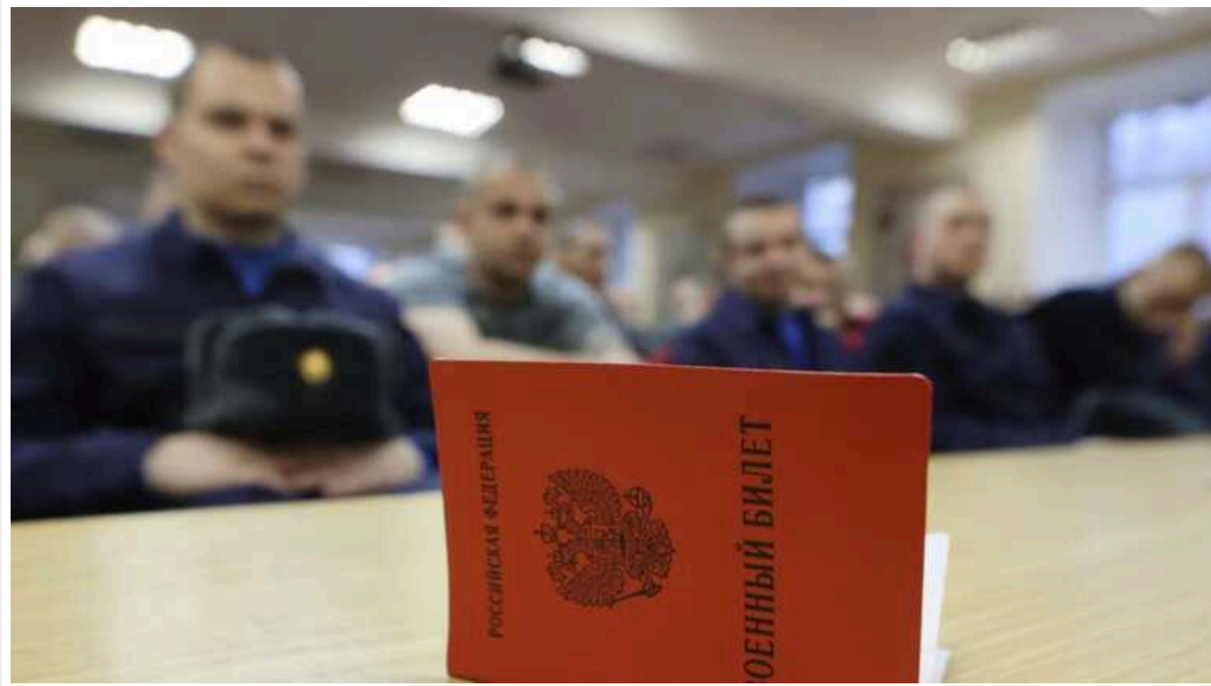
У Росії хочуть збільшити термін служби в армії для "нових громадян"

Держдума розгляне можливість збільшення терміну служби в армії до двох років для іноземців, які отримали російське громадянство. Також пропонується підвищити їхній призовний вік. Про це повідомляють у телеграм-каналі нижньої палати парламенту.