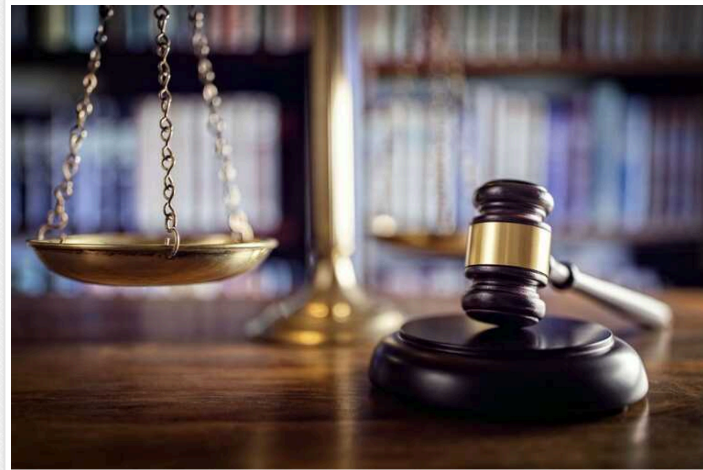
На Волині судитимуть жителя Луцька, який допоміг перевезти 278 ухиянтів через систему «Шлях» і заробив півмільйона гривень

Прокурори Луцької окружної прокуратури скерували до суду обвинувальний акт у кримінальному провадженні про неодноразову організацію 33-річним жителем Луцька незаконного переправлення осіб через державний кордон України.