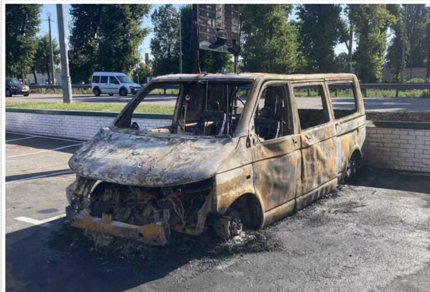
У столиці підпалили автомобіль медичної служби третьої штурмової бригади

Сьогодні вранці, 29 липня, у Києві підпалили евакуаційний автомобіль медичної служби третьої окремої штурмової бригади.