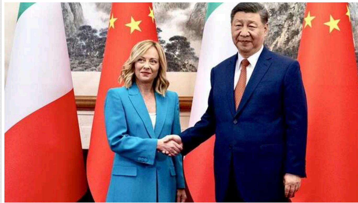
Джорджія Мелоні зустрілася із Сі Цзіньпіном

Прем'єр-міністерка Італії Джорджія Мелоні, перебуваючи з робочим візитом у Китаї, у понеділок, 29 липня, провела переговори з китайським лідером Сі Цзіньпіном. Серед тем - війна Росії проти України.