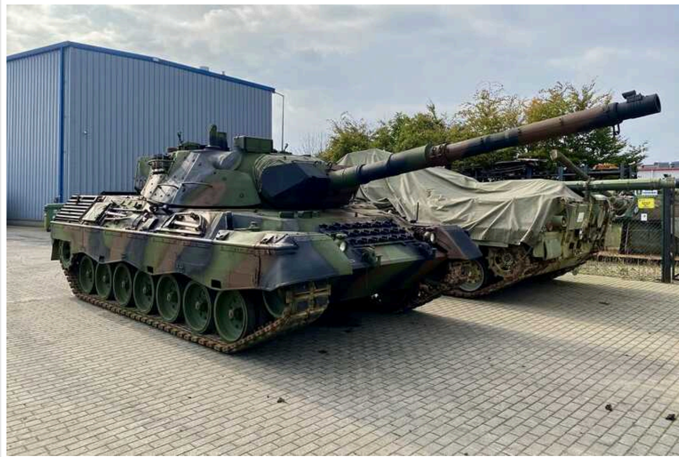
Німеччина разом із Данією передали Україні 8 танків Leopard 1A5

Згідно з переліком німецької військової допомоги, протягом останнього часу уряд Німеччини разом із Данією передали Україні вісім бойових танків Leopard 1A5.