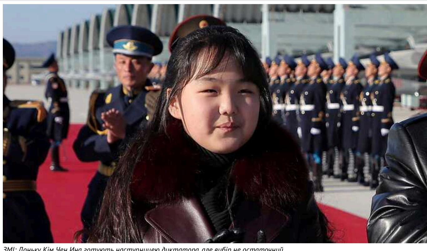
ЗМІ: Доньку Кім Чен Ина готують наступницею диктатора, але вибір не остаточний

Доньку лідера Корейської Народної Демократичної Республіки (КНДР) Кім Чен Ина Чжу Е готують як наступницю північнокорейського диктатора. Утім, вибір поки не є остаточним.