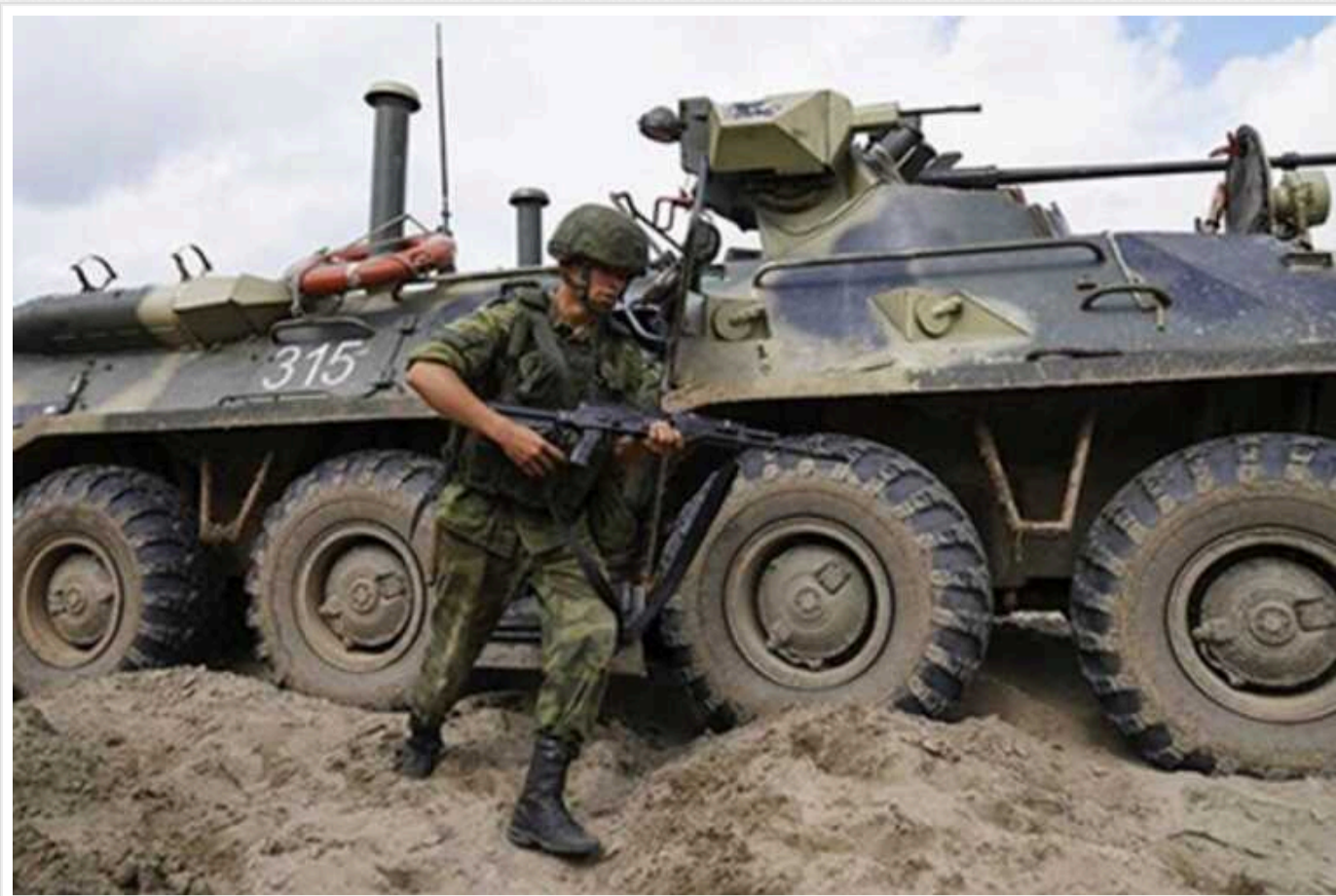
Загарбники, незважаючи на свої шалені втрати, продовжують тиснути на Харківщині, – військовий