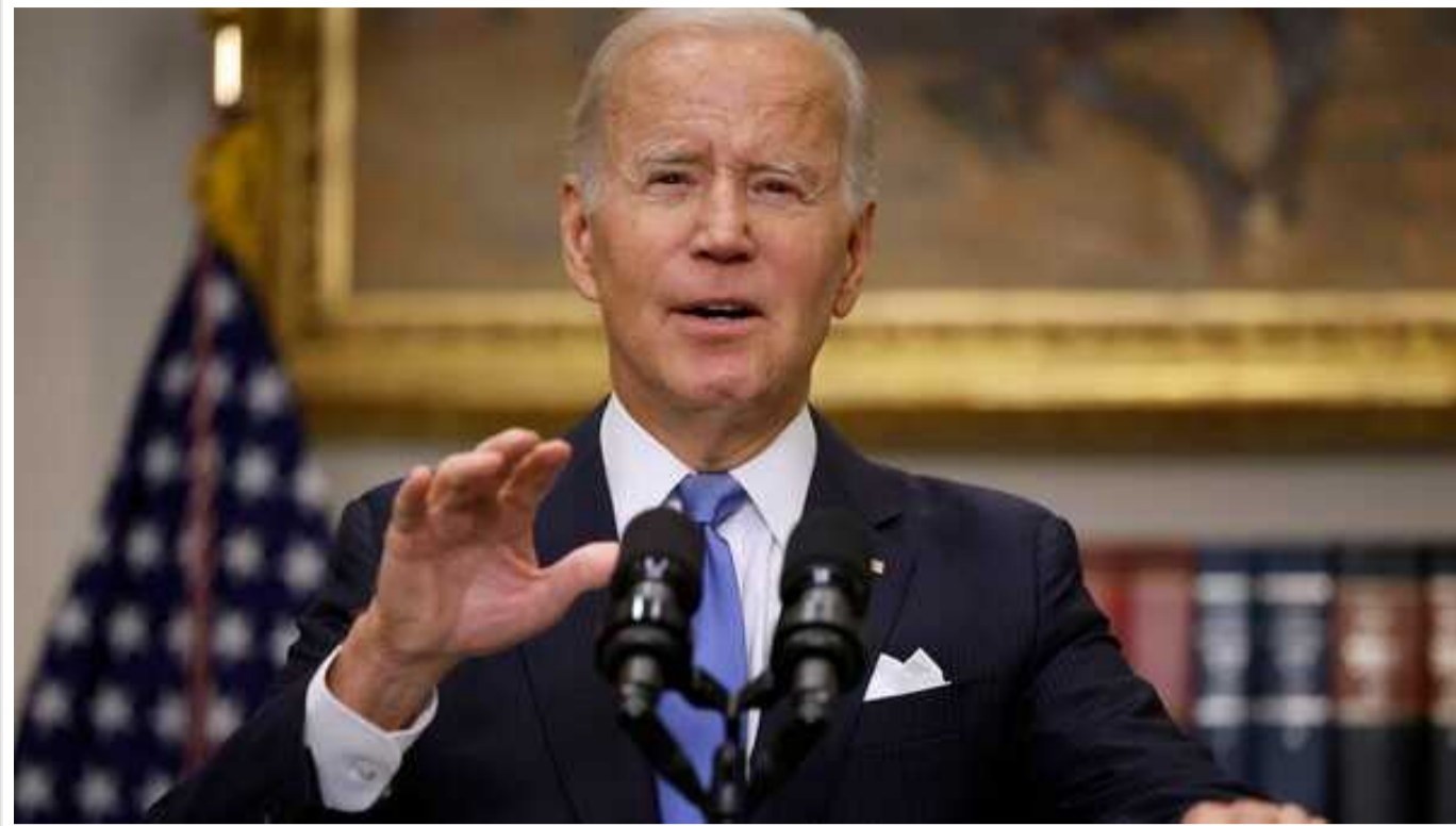
Джо Байден представив план реформування Верховного суду США

Президент США Джо Байден у понеділок презентував план із реформування Верховного суду країни.